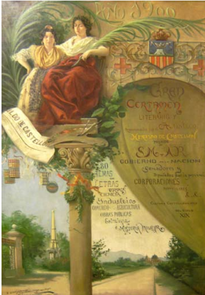
Cartel del Certamen del Heraldo en el que participó J. Rafels (Museo de BB.AA. de Castellón)