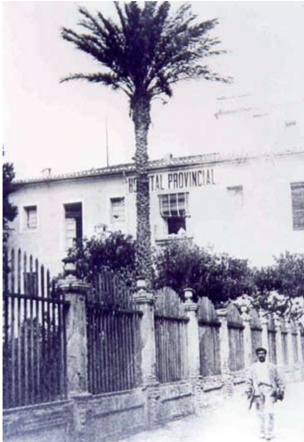
Hospital Provincial en la plaza las Aulas de Castellón, solar que ocupa actualmente la Diputación Provincial. Antiguo hospital medieval de Trullós convertido en Provincial gracias a la labor de J. Rafels (Archivo Diputación de Castellón)