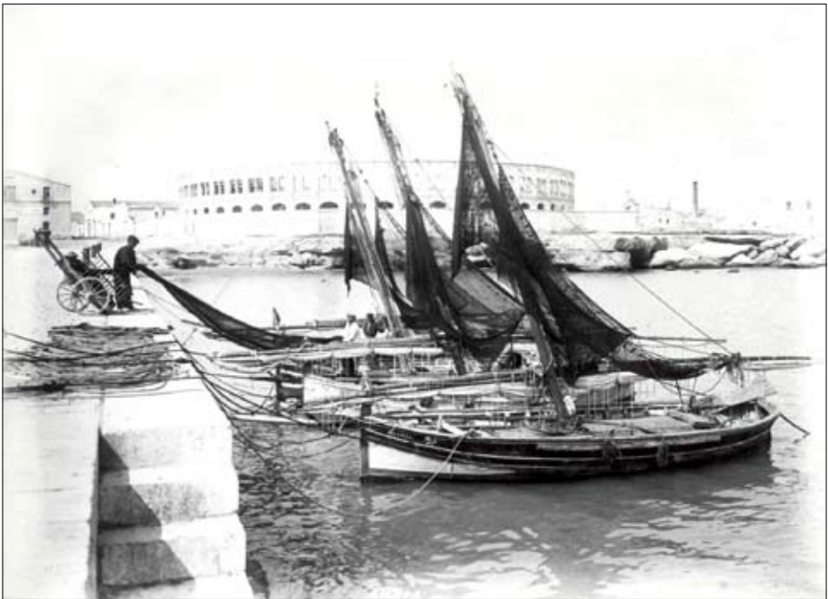
Muelle de poniente, conocido como contramoll, cuya construcción fue solicitada por J. Rafels