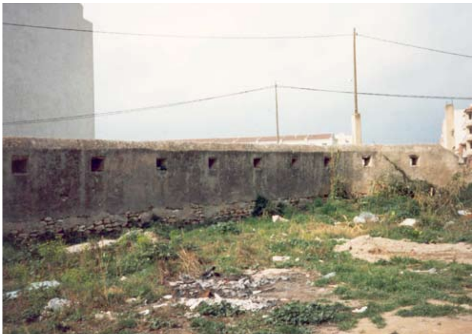
Muralla construida tras la liberación de Vinaròs de la ocupación carlista durante la Tercera Guerra Carlista