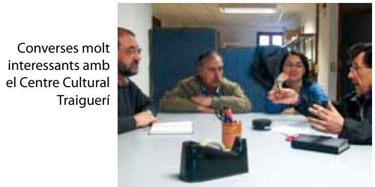
Converses molt interessants amb el Centre Cultural Traiguerí