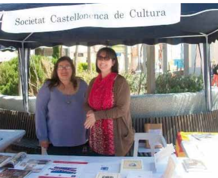
També hem participat a la Fira del Llibre 2012