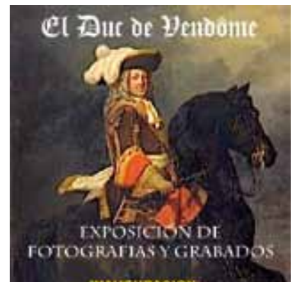
Commemoració del Centenari de la mort a Vinaròs del Duc de Vendôme